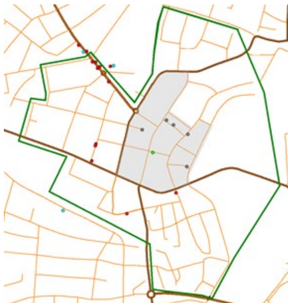
Bild 6 Grön linje: område för handlingsplan p-skiva Grått område: stadskärnan Grön prick: 10 min Röda prickar: 15 min Gråa prickar: 30 min Turkosa prickar: 1 timme