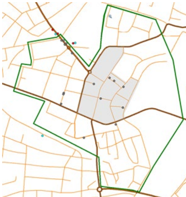
Bild 8 Grön linje: område för handlingsplan p-skiva Grått område: stadskärnan Röda prickar: 15 min Gråa prickar 30: min Turkosa prickar: 1 timme Turkos prick: 1 timme

Samma reglering 30 minuter oavsett målpunkt och oavsett placering innanför eller utanför stadskärnan. Det här är den enklaste regleringskombinationen. Dock innebär det att det kan vara problem att hämta ut pengar från bankomat eller hämta mat/fika från de målpunkter som har den servicen.