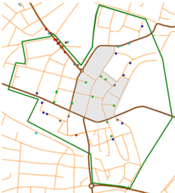
Bild 2: Visar korttidsparkeringar reglerade 10 min - 4 timmar inom område för parkeringsförbud. Grön linje: Område för handlingsplan p-skiva Skuggad yta = stadskärna Gröna prickar: 10 min Röda prickar: 15 min Gråa prickar: 30 min Turkosa prickar: 1 tim Blåa prickar: 2tim eller 4 tim

I Falkenbergs centralort är samtliga korttidsparkeringar i nuläget avgiftsfria, se bild 2 nedan. Gatorna i stadskärnan är reglerade med parkering tillåten mot avgift 9-18 vardagar. Detsamma gäller Ågatan delen Doktorsträtet norrut.