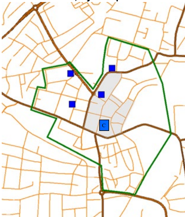
Bild 4 Grön linje: område för handlingsplan p-skiva Grått område: stadskärnan Blå kvadrat: samlingsparkering C: P-hus Centrum

På samlingsparkeringarna Stortorget, Skärdegen, Drivbänken, Nyhemsplan föreslås reglering av parkeringen parkeringsskiva 11 timmar alternativt avgift utan parkeringsskiva.